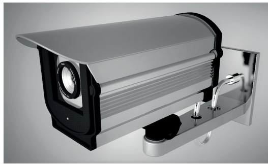
Figura 2: Un ejemplo de una cámara de seguridad