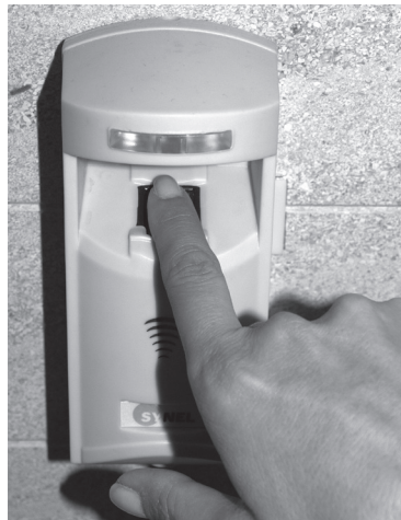
Figura 1: Un empleado utiliza la autorización biométrica para acceder a la oficina de Bright Creativa