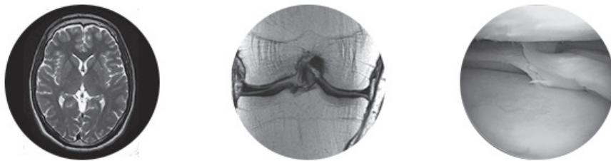
Figura 3: Ejemplos de imágenes utilizadas en el nuevo sistema de IA